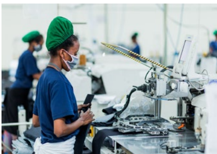
Travailleuse appliquant les leçons tirées du module sur la Sécurité et la Santé au travail pendant la pandémie de Covid-19

La Formation SCORE est conçue pour apporter des améliorations durables aux pratiques des PME en mettant en évidence le lien entre la productivité et les pratiques sur le lieu de travail : une situation gagnant-gagnant pour les employés et les employeurs.