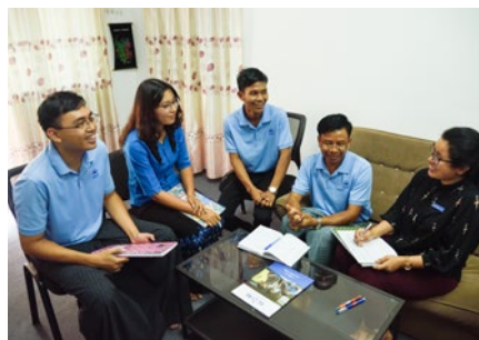
Formatrice SCORE receillant les retours de l'équipe d'amélioration de l'entreprise