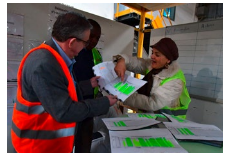
Mesure des performances et identification des possibilités d'amélioration au moyen d'un système de suggestions du personnel