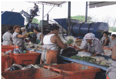
Reiclando desechos en Brasil

Para la OIT, la noción de empleos verdes traduce la transformación de economías, empresas, lugares de trabajo y mercados laborales en una economía que genera bajas emisiones y provee trabajo decente.