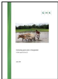
“Estimando empleos verdes en Bangladesh” Programa empleos verdes e Integración

Los ejemplos a continuación ilustran las publicaciones conjuntas realizadas por la OIT recientemente: