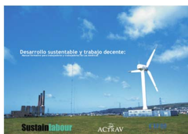
Manual de formación "Desarrollo sostenible y trabajo decente"

Dos cursos en línea sobre desarrollo sostenible y trabajo decente – acompañadas por material formativo – fueron llevados a cabo en las Américas. Adicionalmente, una adaptación de los mismos, creada para el África anglófona, fue probada y adaptada a un curso de formación que se llevó a cabo en Kenia, en agosto del 2011