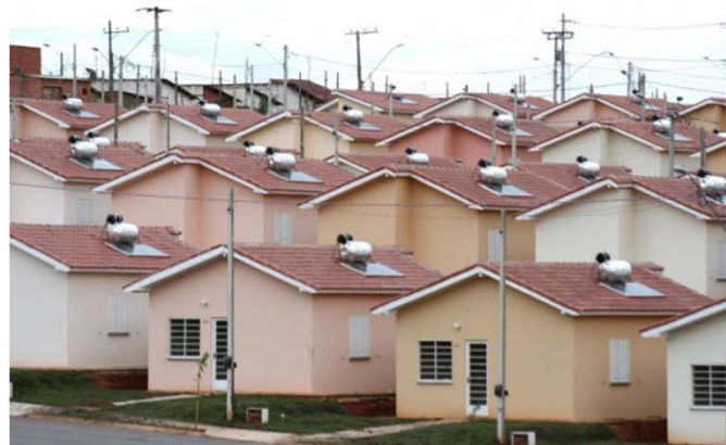
Proyecto de viviendas populares en Brasil

Una formación profesional será por lo tanto esencial, en particular para los que instalan sistemas de calefacción solar. El programa de formación profesional desarrollado por la OIT se volvió parte del plan operacional preparado por el grupo de trabajo ministerial.