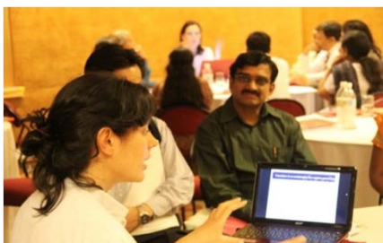
Curso de formación del CIF, India, 2010

En 2010, el primer “foro de formación sobre empleos verdes: estrategias locales y acciones” abordó los desafíos medioambientales y las oportunidades a nivel de la comunidad y la provincia. Un segundo foro, que incluyó visitas sobre el terreno, tuvo lugar en mayo del 2011. Además, desde el 2010, los empleos verdes fueron incluidos en la Academia de Verano sobre Desarrollo Empresarial Sostenible. Cada año, el Departamento Creación de Empleos y Desarrollo de Empresas de la OIT organiza una jornada de formación sobre estrategias de inversión intensivas en empleo.