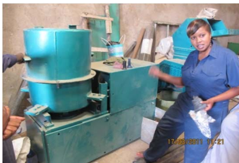
Empresa verde en Kenia

Las experiencias de Kenia serán reproducidas en Tanzania y en Uganda.