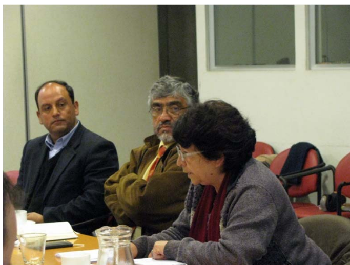
Reunión con sindicalistas, oficina de la OIT en Santiago

Frente al hecho de que el programa de formación llega a su fin en 2011, el grupo ha asumido el reto de desarrollar una serie de principios y de definir áreas de acción para la organización en el sector de empleos verdes. En un futuro cercano, su idea es formalizar el grupo de trabajo y crear una unidad de medio ambiente en el seno de la Sede de la CUT. El grupo también decidió contribuir a la conferencia de Rio+20 con su propio informe de posición.