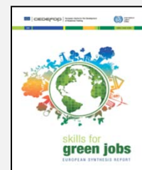
Calificaciones para empleos verdes : informe de síntesis europeo