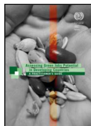
“Evaluando el potencial de empleos verdes en países en vía de desarrollo” Programa empleos verdes e Integración