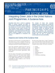
“Integrando los empleos verdes en los programas conjuntos de la ONU”, Programa empleos verdes e Integración