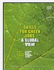
Calificaciones para empleos verdes: una visión global

Cedefop realizó la investigación en seis países europeos incluidos en el estudio. El resumen separado muestra que, aunque la necesidad de nuevas competencias lleva en ocasiones a la creación de nuevas calificaciones estándar, la integración del desarrollo sostenible y de desafíos ambientales en las calificaciones existentes se está generalizando.