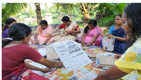
Mujeres empresarias en India

El grupo de trabajo benefició de la ayuda financiera y técnica del Programa empleos verdes de la OIT. La asistencia técnica fue particularmente pertinente en la identificación y las respuestas desarrolladas frente a las lagunas de competencias, así como en la conducción de enfoques prácticos e innovadores que permitan promover empleos verdes.