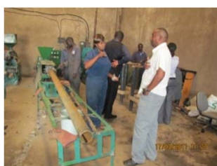
Producción de postes de reciclaje