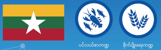
ပင်လယ်စာကဏ္ဍ စိုက်ပျိုးရေးကဏ္ဍ

ဤအစီအစဉ်သည် မြန်မာနိုင်ငံ၏ တင်ပို့ကုန် စီးပွားရေးကဏ္ဍအတွက် ကြီးမားသော အလုပ်ရှင်များလည်းဖြစ်၊ အရေးကြီးသောထည့်ဝင်မှုပေးရန် အလားအလာလည်းရှိသည့် ပင်လယ်စာနှင့် စိုက်ပျိုးရေးကဏ္ဍများကို ဦးတည်ဆောင်ရွက်ပါသည်။