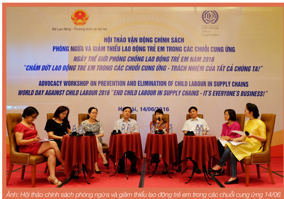
Ảnh: Hội thảo chính sách phòng ngừa và giảm thiểu lao động trẻ em trong các chuỗi cung ứng 14/06

Hơn 20 báo và tạp chí lớn đã đưa tin và bài về hội thảo vận động chính sách cũng như các câu chuyện và tin tức về vấn đề lao động trẻ em trong chuỗi cung ứng. Chương trình thời sự ngày 15 tháng 6 của Đài truyền hình Việt Nam cũng đã đưa tin về hội thảo cũng như về vấn đề lao động trẻ em trong các chuỗi cung ứng.