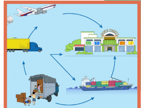
Lao động trẻ em trong các chuỗi cung ứng