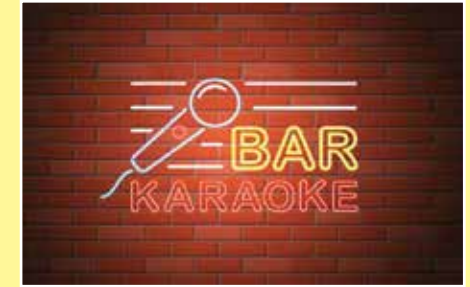
Sòng bạc, quán bar, vũ trường, phòng hát karaoke, khách sạn, nhà nghỉ, phòng tắm hơi, phòng xoa bóp