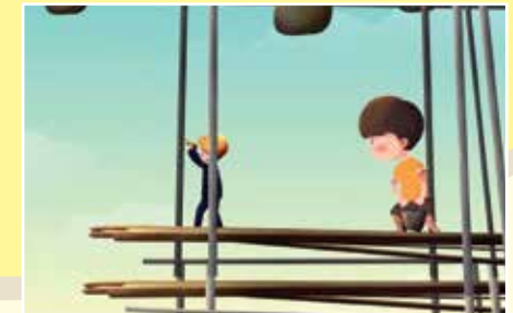
Công trường xây dựng