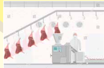
Cơ sở giết mổ gia súc