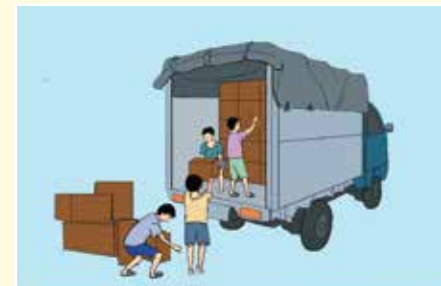
Nơi làm việc khác gây tổn hại đến sức khỏe, sự an toàn và đạo đức của người chưa thành niên

Để biết thêm thông tin, hãy tìm hiểu điều 143, 144, 145, 146, 147 Luật lao động năm 2019 và Thông tư số 10/2013/TT-BLĐTBXH; Thông tư số 11/2013/TT-BLĐTBXH của Bộ LĐTBXH