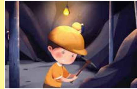
Dưới nước, dưới lòng đất, trong hang động, trong đường hầm