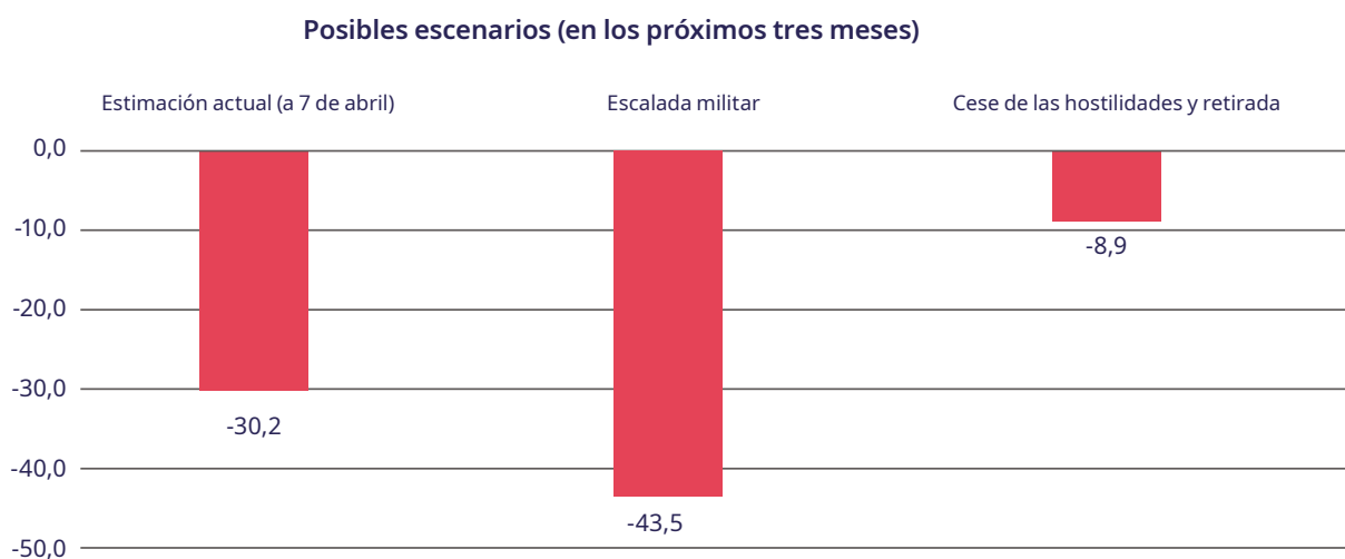
Gráfico 1. Pérdida de empleos en Ucrania (en %, cambios en comparación con el periodo anterior al conflicto)