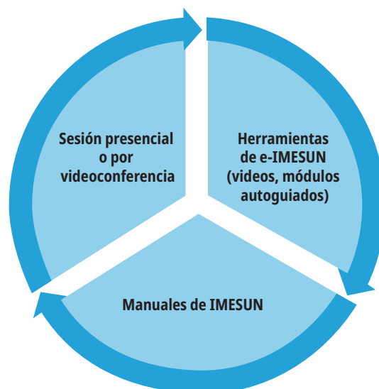
Figura 2: Proceso de formación IMESUN

Donde es posible la entrega presencial de capacitaciones de IMESUN, los/las facilitadores/as pueden utilizar las herramientas de e-IMESUN para complementar sus capacitaciones de emprendedores. Por ejemplo, usted podría pedir a sus participantes que miren un video o revisen el módulo autoguiado antes de la sesión presencial sobre contenido específico. Posteriormente, los/las participantes llegarían a la sesión con un conocimiento básico de lo que se va a presentar, y esto permitirá profundizar en el contenido de la sesión presencial.