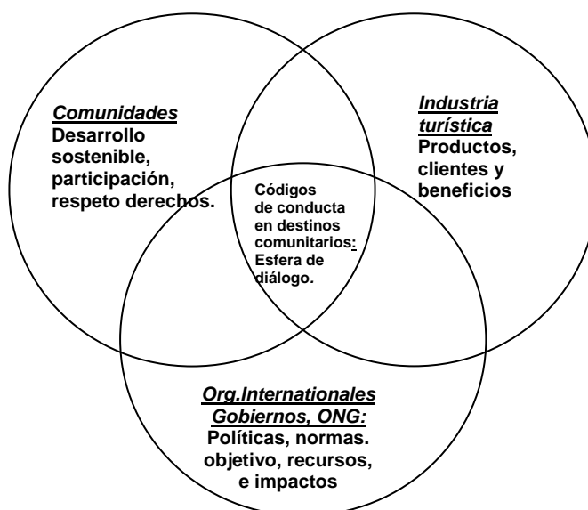
Gráfico núm. 2. Intereses que persigue cada uno de los actores en las operaciones de turismo comunitario

El gráfico adjunto muestra como la elaboración de un código de conducta genera espacios de diálogo entre los diferentes actores, cada actor buscando respuesta a sus propios intereses.