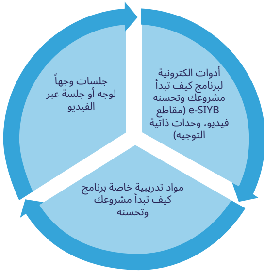
الشكل 2: عملية تدريب لبرنامج كيف تبدأ مشروعك وتحسنه

عندما يكون التدريب وجهًا لوجه ممكنًا، يمكن للمدرّبين استخدام الأدوات الإلكترونية لبرنامج كيف تبدأ مشروعك وتحسنه e-SIYB لاستكمال تدريبهم على رواد الأعمال. على سبيل المثال، يمكنك أن تطلب من المتدربين مشاهدة مقطع فيديو أو الذهاب إلى الوحدة الموجهة ذاتيًا قبل الجلسة وجهًا لوجه حول هذا المحتوى المحدد. وبهذه الطريقة، سيصل المشاركون إلى الجلسة مع معرفة أساسية بما ستقدمه، ويمكنك التعمق في المحتوى في الجلسة وجهًا لوجه.