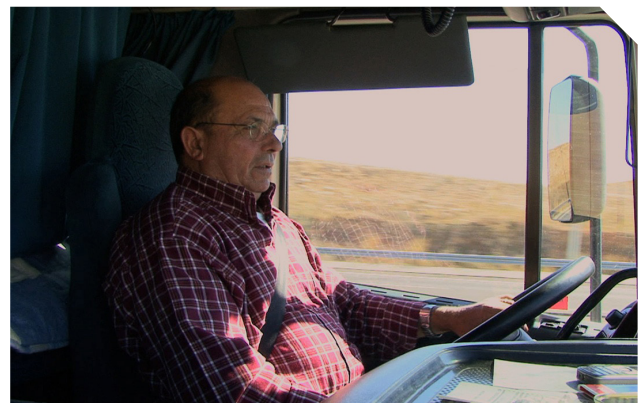
La vie sur roues : chauffeur de camion long-courrier en Espagne.

Les gouvernements, les partenaires sociaux et les parties prenantes de la chaîne du transport routier 3 – y compris expéditeurs, réceptionnaires, acheteurs de services de transport et intermédiaires – devront prendre des mesures urgentes pour