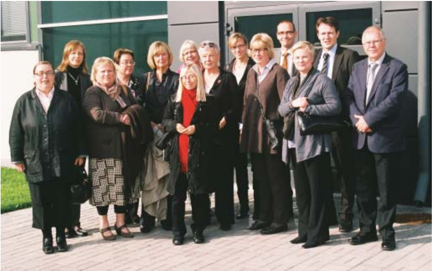
Suomen ILO-neuvottelukunta Nokian Renkaiden tuotantolaitoksen edustalla Vsevolozhkissa, Pietarin lähistöllä.